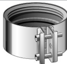
Jet- koppling, MA