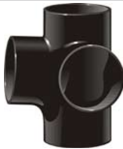
Hörngrenrör, MA 88,5°