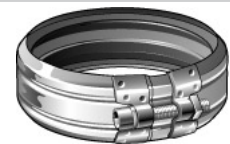
Jet- koppling, Ultra, MA