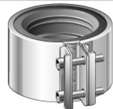
Jet Redux koppling, MA