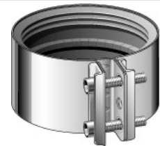
Jet- koppling, rostfri, MA